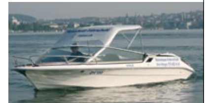
Im Winter geheizte Boote